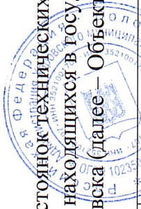
Схема размещения гаражей, являющихся некапитальными сооружениями, стоянок технических или других средств передвижения инвалидов вблизи их места жительства на землях и земельных участках, находящихся в государственной или муниципальной собственности, на территории города Харовска (далее – Объекты)

Утверждена постановлением Администрации Харовского муниципального района № 1144 от 31.08.2012 года