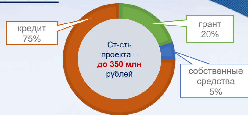
схема финансирования стоимости проекта, реализуемого с участием льготного инвестиционного кредита